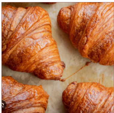
mini croissants tastets