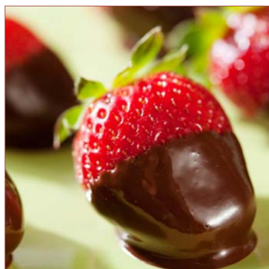
maduixa amb caputxa de xocolata