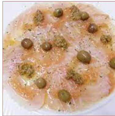
Carpacció de bacallà elaborat a la botiga