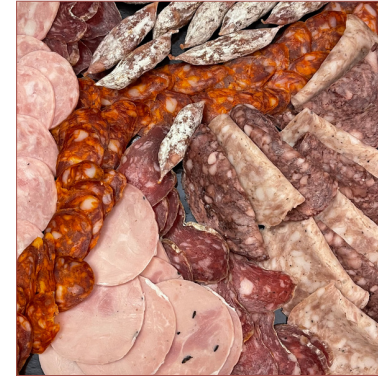
Embotits Ibèrics De Salamanca