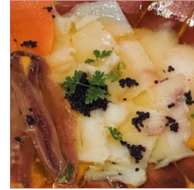
Variat de fumats

subtil i suau 4 racions 150gr 18€ 8 racions 300gr 35€