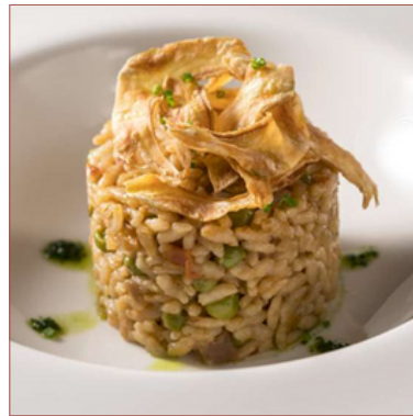
arròs amb verdureta de temporada