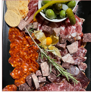
Embotits km0 De la Garrotxa