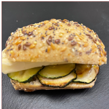
Entrepà carbassó acompanyat de brie 4 unitats 15€ 6 unitats 22€