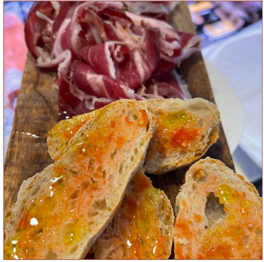
Pernil duroc Vall los Pedroches