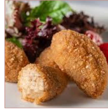
croquetes artesanes artesanes