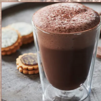
xocolata desfeta caraïbe, guanaja i jivara