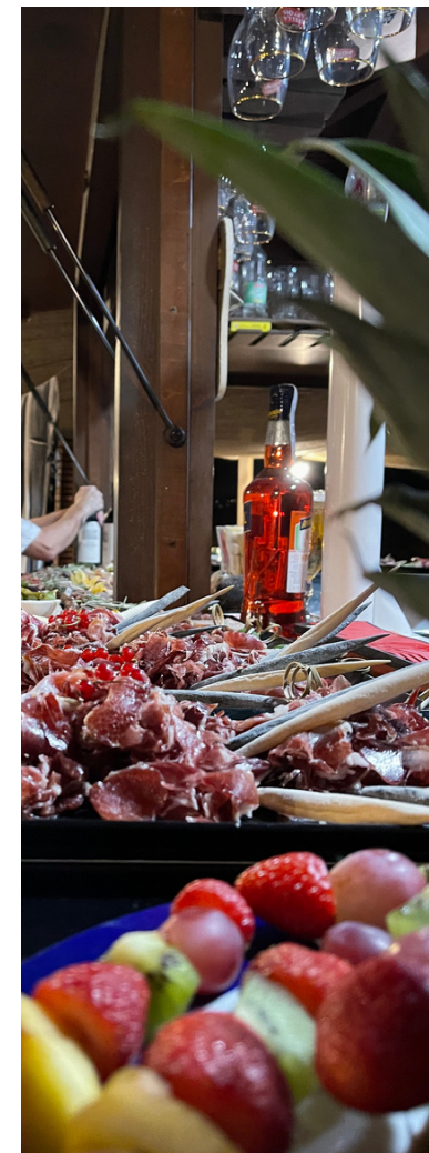
fruit fresh colors