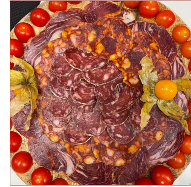
Tast d'embotits Experience