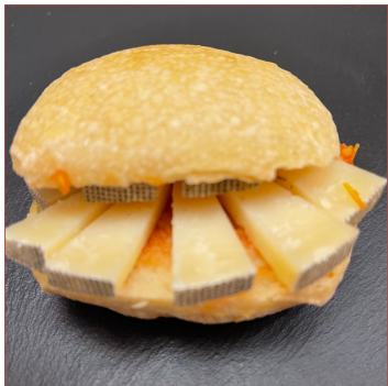
mini formatge km0 artesà 9 unitats 20€ 18 unitats 39€