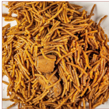
fieduà de tota la vida