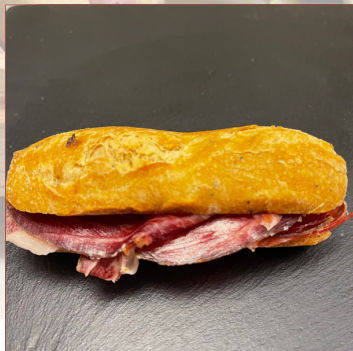
mini pernil ibèric Guijuelo 9 unitats 35€ 18 unitats 65€