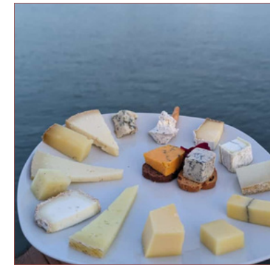
Tast de formatges Experience