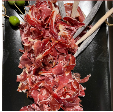
Pernil Ibèric Guijuelo