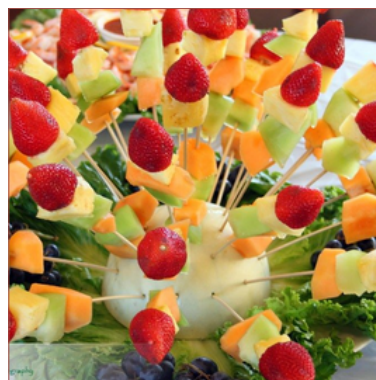
Enfilall fruita temps salut