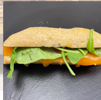
mini salmó i rúcula semi-salvatge 9 unitats 25€ 18 unitats 48€