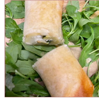
rotllets de verdura elaborats a la botiga

1 u. carbassó 2,75€ 1 u. alberginia 2,75€