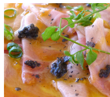
smoked flors de fumats