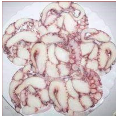
Carpacció de pop amb patata confitada