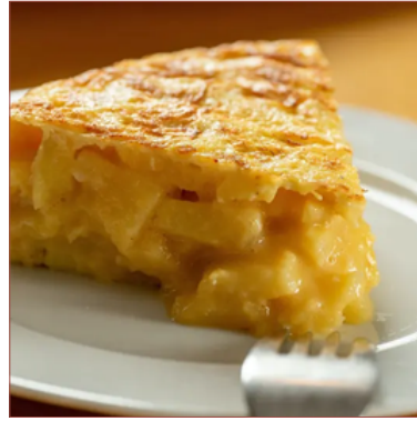
truita de patata i ceba autèntica de bar