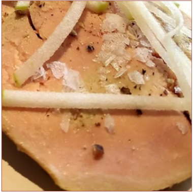
micuit foie Rougie