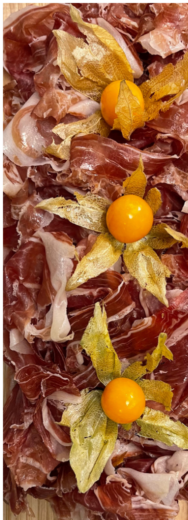
embotit espectacle d'ibèrics