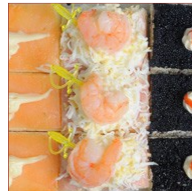
canapés salats variats