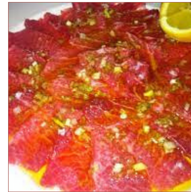
Carpacció de tonyina elaborat a la botiga