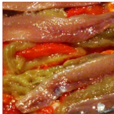
pa amb tomata amb anxova i escalivada