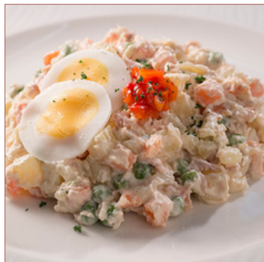
ensaladilla russa clàssica