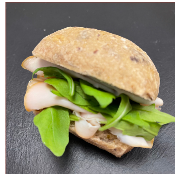
Entrepà gall d'indi very healthy 4 unitats 11€ 6 unitats 16€