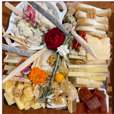
Formatges del món D'artesans d'arreu