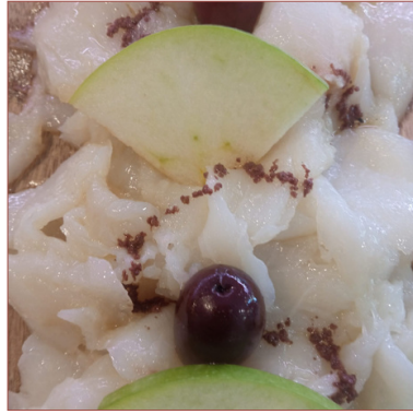
Bacallà fumat d'Islàndia