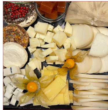
Formatges Km0 D'artesans catalans