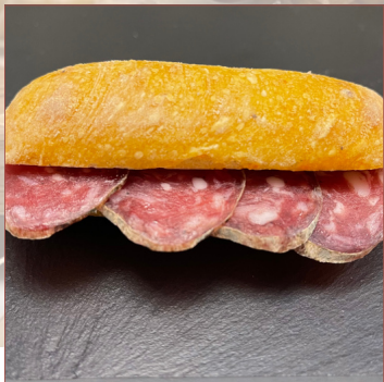
mini km0 Embotit de la garrotxa 9 unitats 20€ 18 unitats 39€