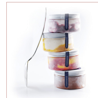
Gelats artesans Torroella de Montgrí