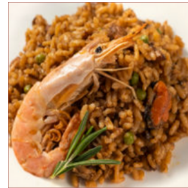
arròs casolà carn i peix de l'àvia