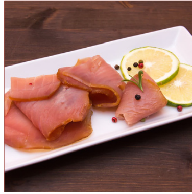
Tonyina fumada vermella i salvatge