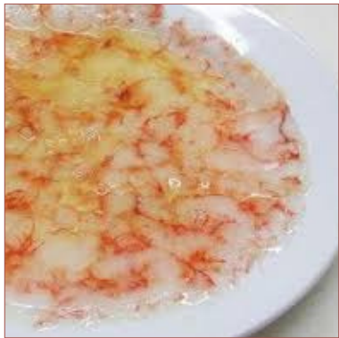
Carpacció de gambes de Palamós

Salmó, bacallà, tonyina, anguila i sardina 4 racions 300gr 30€ 6 racions 450gr 45€