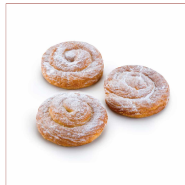
mini ensaimades dolces i ensucrades