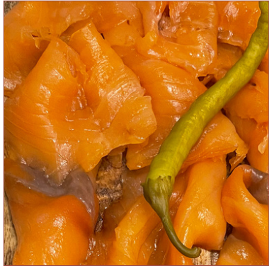
Salmó fumat semi-salvatge