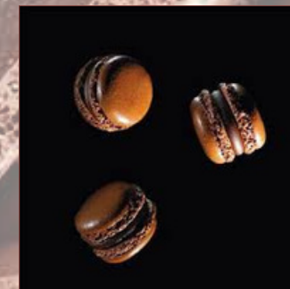
Macarons de sabors Valrhona