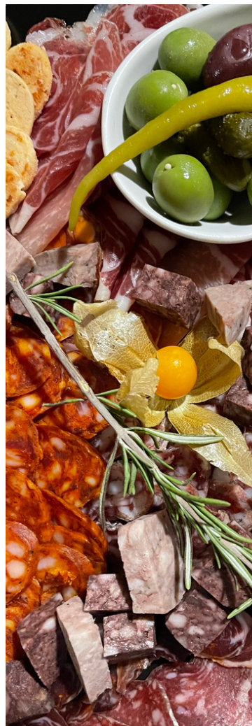
Mix la miscel·lània