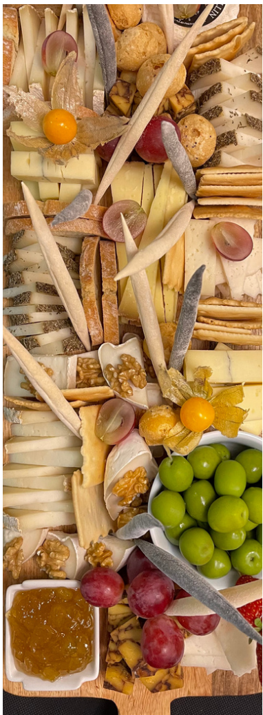
cheese festa de formatges del món