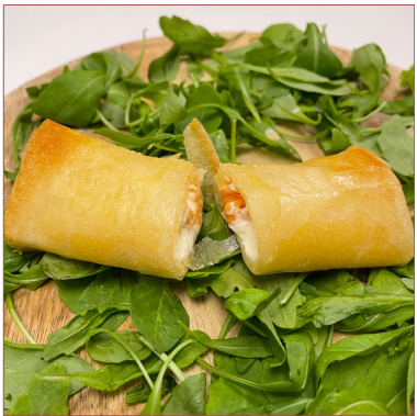
rotllets premium elaborats a la botiga

1 u. carbassó 2,75€ 1 u. alberginia 2,75€