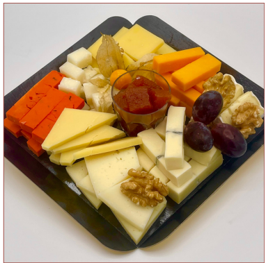
Formatges Clàssics De tota la vida