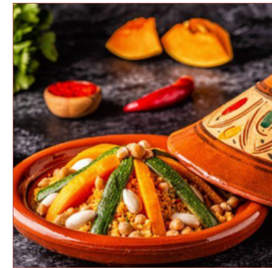
cuscus marroquí d'en Mohamed