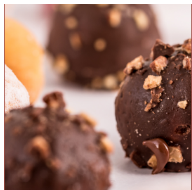
Pop dots el forat del donut