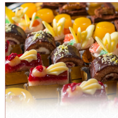
mini pastissets dolços petits pecats