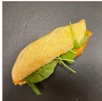
Entrepà salmó amb mascarpone 4 unitats 19€ 6 unitats 28€