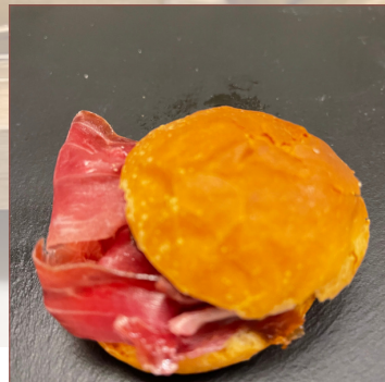
mini espatlla ibèrica Guijuelo 9 unitats 34€ 618unitats 66€