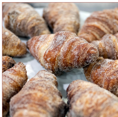
mini xuixos Girona més