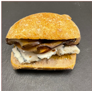
Entrepà alberginia i formatge blau 4 unitats 15€ 6 unitats 22€