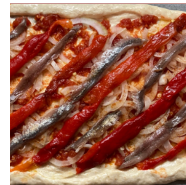
coca de recapte verdura o escalivada