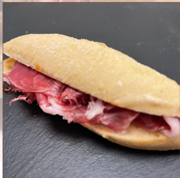
mini pernil duroc Garrotxa 9 unitats 20€ 18 unitats 39€