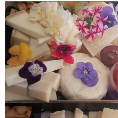
Formatges Premium Selecció